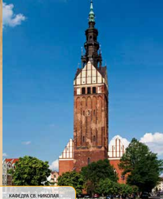
КАФЕДРА СВ. НИКОЛАЯ

Первые шаги нашей прогулки направляем к XII-вековому Кафедральному собору Святого Николая ①, который возвышается над Старым городом (высота колокольной башни составляет 95 м).