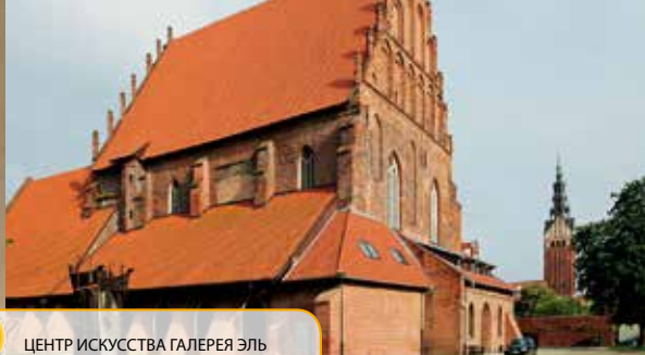
ЦЕНТР ИСКУССТВА ГАЛЕРЕЯ ЭЛЬ

нику гидротехнического искусства. Исключительность этого водного пути основана на преодолении на отрезке 83 километров 100-метровой разницы уровней воды. Это происходит при помощи системы шлюзов и ступеней, которые работают с 1860 года. Ступени являются рельсовыми устройствами, которые приводятся в движение течением воды, а преодолевающие их корабли «плывут» по траве.