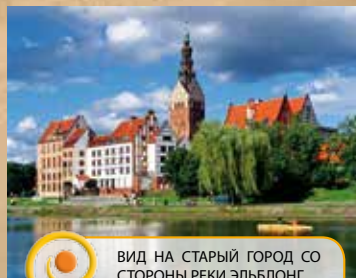
ВИД НА СТАРЫЙ ГОРОД СО СТОРОНЫ РЕКИ ЭЛЬБЛОНГ

Оставляя Старый города сзади Торговых ворот, мы проходим возле прежней Гимназии императрицы Августы Виктории (7) (в настоящий момент здесь также находится школа), переходим через ул. Рыцарска и идем по аллеякам парка Планты. Но что это? С той стороны улицы весело выглядит цветной танк (8). Такая модель танка играла главную роль в популярном польском военном сериале. Снимок возле него будет интересным воспоминанием в семейном альбоме.