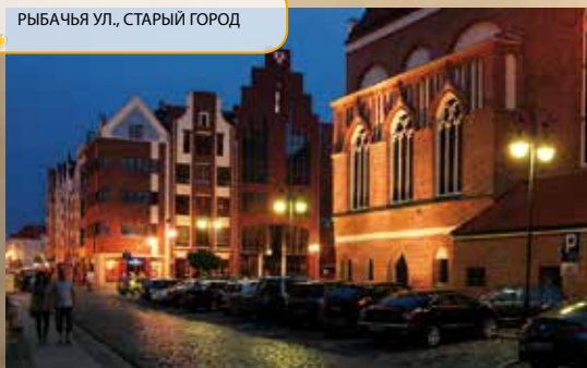
РЫБАЧЬЯ УЛ., СТАРЫЙ ГОРОД

Эльблонгский Старый город с учетом площади является одной из крупнейших в Европе территорий, охваченных комплексными археологическими исследованиями. Постепенной реконструкции предшествуют археологические работы, которые ведутся тут с 1980 года по сегодняшний день. На основании огромного количества найденных памятников старины XIII-XIX веков известно, как выглядела будничная жизнь жителей Эльблонга, как они жили, работали, развлекались, во что одевались и что ели. Многообразие и разнообразие найденных предметов свидетельствует о богатстве прежних жителей Эльблонга и их интенсивных торговых контактах практически со всей Европой от Норвегии до Испании, Англии и Италии.